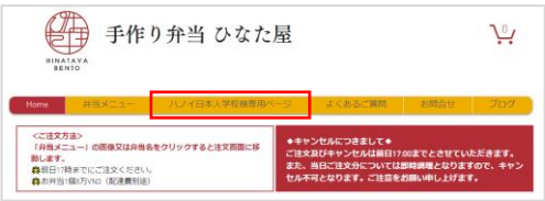
▲ Trang chủ trên PC

Truy cập (bằng PC hoặc điện thoại thông minh) tới website và nhấn vào “Trường tiếng Nhật của Hà Nội” trên thanh trình đơn.