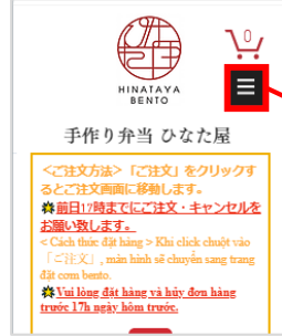
▲ trên điện thoại