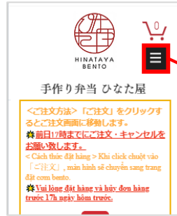
▲スマートフォン画面